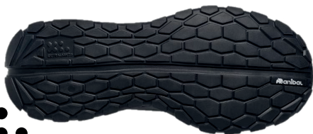
Image plante relief semelle

*Paire de lacets de rechange gris incluse.