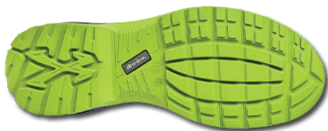
Image plante relief semelle