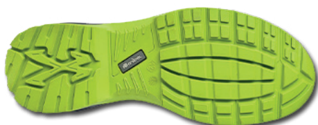
Image plante relief semelle

Fabricant: Marca Protección Laboral S.L.