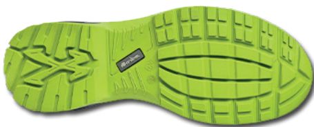
Imágen planta relieve suela