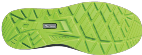
Imágen planta relieve suela

Fabricante: Marca Protección Laboral S.L.