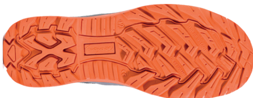
Imagen planta relieve suela

Fabricante: Marca Protección Laboral S.L.