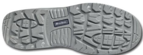
Imágen planta relieve suela